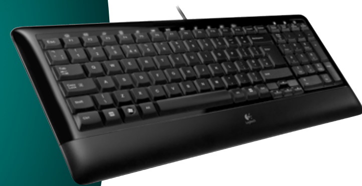
Logitech Compact Keyboard K 300