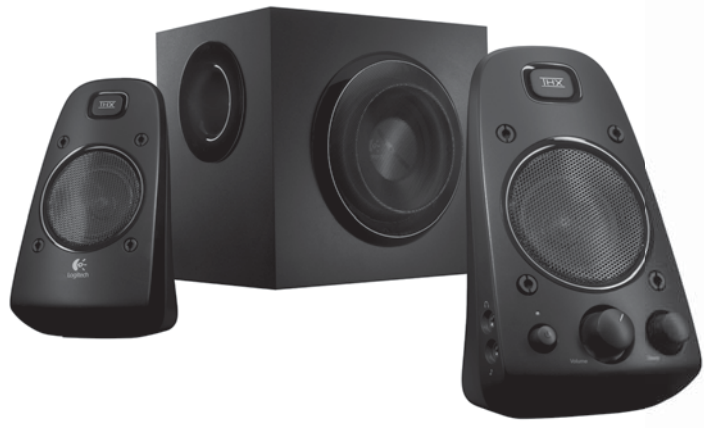
Model: S-00105 (110V~) S-00104 (220-240V~)