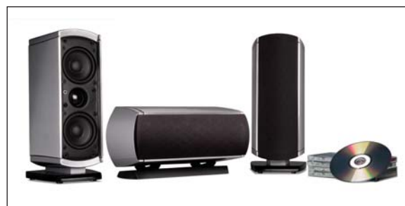
VM10 (APARECE COMO ALTAVOZ IZQUIERDO, CENTRAL Y DERECHO)