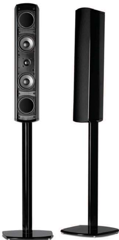
VM20 (PEDESTAL DE PISO OPCIONAL)